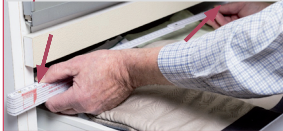
Schritt 2: Messen Sie die Breite des Korpus – und zwar innen!