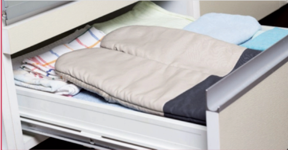
Schritt 1: Öffnen Sie die Schublade