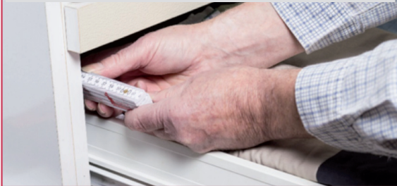
Schritt 3: Jetzt die Tiefe bis zur Rückwand messen